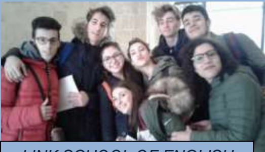
LINK SCHOOL OF ENGLISH